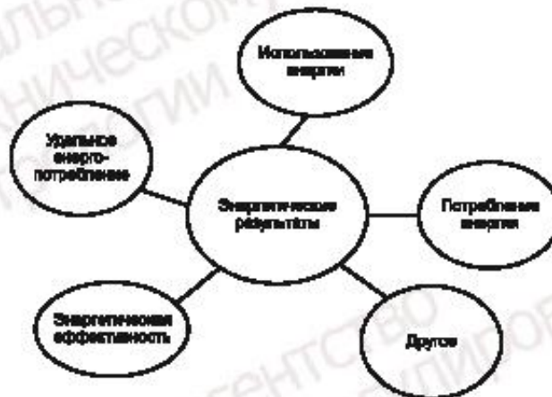
Рисунок А.1 — Концептуальное представление энергетических результатов

Концептуальное представление энергетических результатов приведено на рисунке А.1.