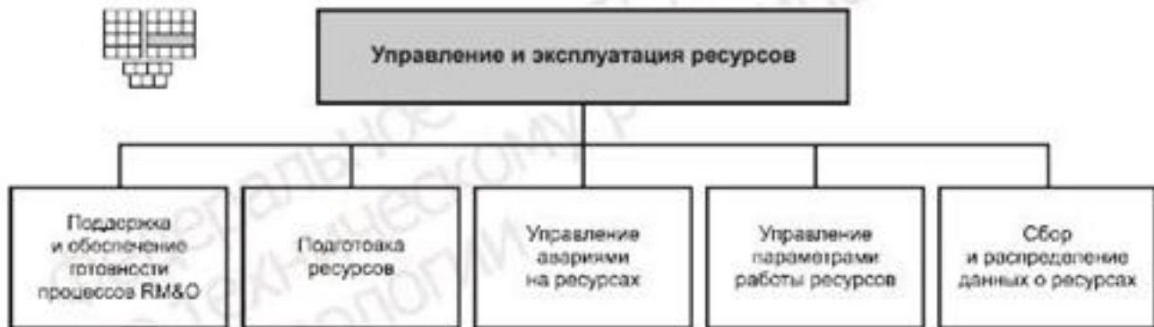
Рисунок 3 — Декомпозиция группы процессов RM&O на элементы процессов уровня 2

6.1 Структура горизонтальной группы процессов RM&O — «Управление и эксплуатация ресурсов» и соответствующие элементы процессов уровня 2 приведены на рисунке 3. Идентификатор RM&O: 1.1.3