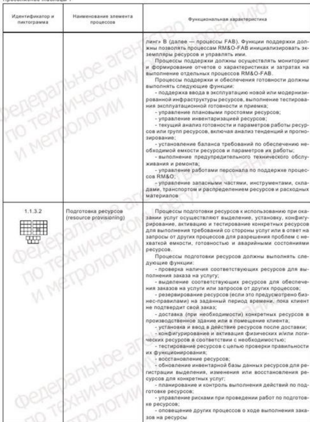
Продолжение таблицы 1