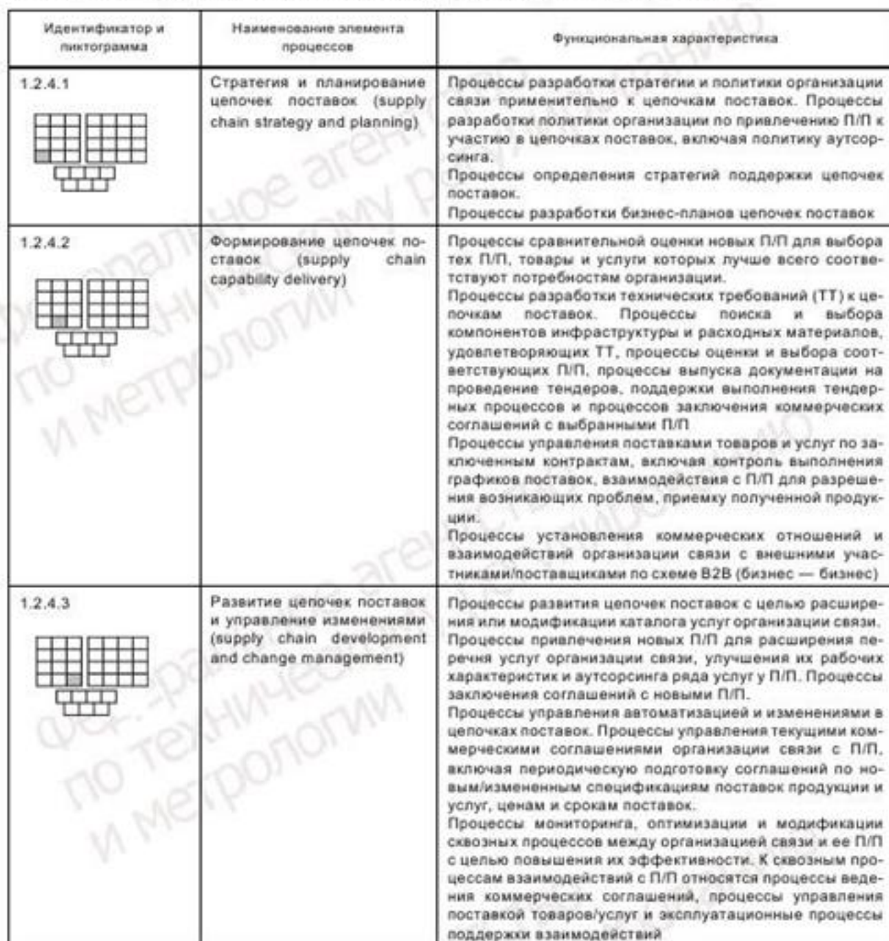
Т а б л и ц а 1 — Функциональные описания элементов процессов уровня 2 для группы SCD&amp;M