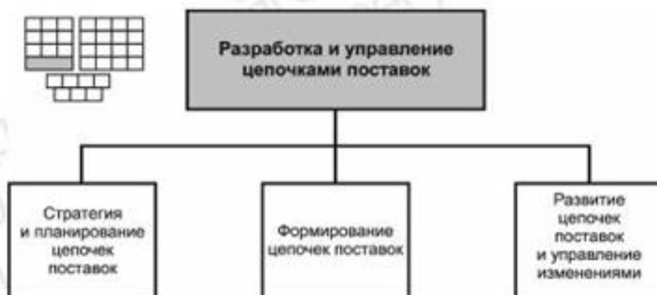
Рисунок 3 — Декомпозиция группы процессов SCD&M на элементы процессов уровня 2

6.1 Структура горизонтальной группы процессов SCD&M — «Разработка и управление цепочками поставок» и соответствующие элементы процессов уровня 2 приведены на рисунке 3.