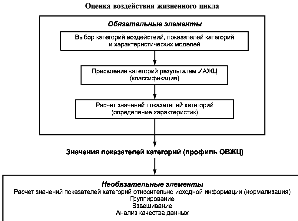
Рисунок 1 — Элементы фазы ОВЖЦ

4.3.2 К обязательным элементам ОВЖЦ относят: