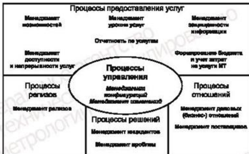
Рисунок 1 — Процессы менеджмента услуг